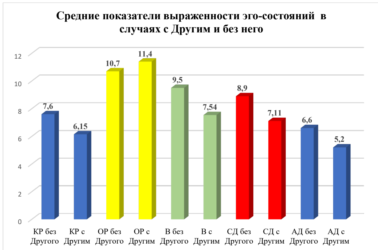
Рис. 1 Средние показатели выраженности эго-состояний в случаях с Другим и без него

Для того, чтобы проверить нашу гипотезу, мы сделали следующий шаг. А именно проанализировали разницу функциональных эго-состояний между респондентами, которые состоят в романтических, дружеских или партнерских взаимоотношениях со значимым Другим, и которые находятся в противоположных этим отношениям. Первый тип взаимосвязи в отличие от вторых характеризуется близостью, доверием и теплотой общения. Отметим, что группа испытуемых с Другим была нами разделена по вышеописанным признакам. Таким образом в соответствии с этим выборка стала независимой и дальнейший анализ проводился благодаря применению U-критерия Манна-Уитни. Результаты представлен ниже в таблице 2.3.5.